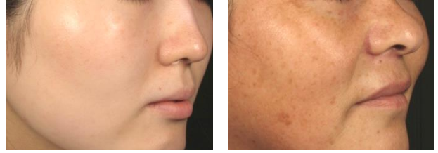
「肌トーン」が見た目の印象を大きく左右します

肌に黄褐色のAGEsが蓄積すると、肌全体がくすんで見えてしまいます。クリアな肌を維持する事で内部反射光が増加し輝くような印象につながります。